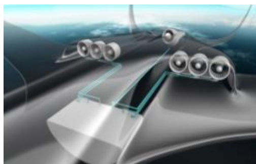
Figure 1 : Concept E-thrust à propulsion distribuée

La localisation et la réduction des pertes d'un système énergétique quelconque est un enjeu fondamental. En aérodynamique externe, « la chasse est faite » au point de traînée alors qu'en turbomachine nous ne cessons d'essayer d'augmenter le rendement des compresseurs à travers la notion d'entropie par exemple, qui n'est pas facilement appréhendable. Demain, avec l'avènement, à plus ou moins long terme, de nouvelles architectures propulsives liées à l'hybridation (couplage thermique et électrique) de la propulsion, voir au tout électrique ainsi qu'à la distribution de la propulsion (fig.1), ces questions de réduction de pertes mais surtout lors localisation et leur potentiel de récupération redeviennent primordiales.